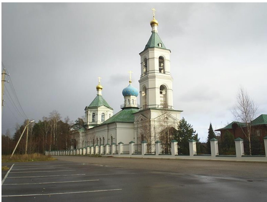
Церковь Троицы Живоначальной в с. Шарапово

Храм был закрыт в 1930-х гг. Восстановление началось в 2002 году.