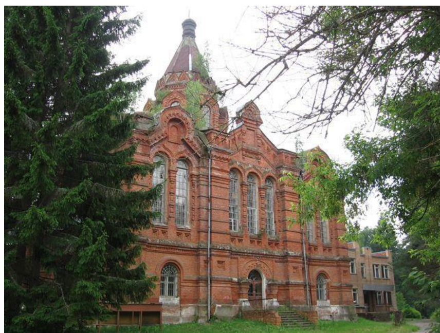
Алекса́ндро-Ма́риинский монастырь, село Евлево