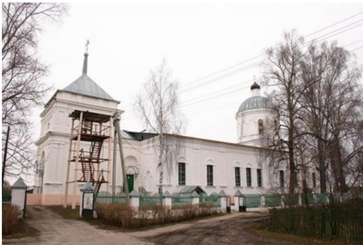
Храм святого великомученика Димитрия Солунского. с. Дмитровский Погост

История храма Димитрия Солунского с XVII по середину XIX века неизвестна.