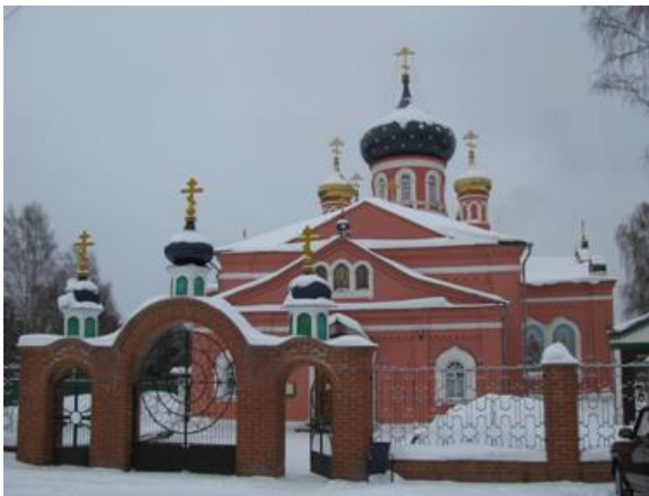
Пятницкая церковь в селе Туголес

В конце 1980-х годов возле храма построили звонницу, а в 1990-х годах расширили территорию храма, сделали новую каменную ограду, в подвальном помещении оборудовали крестильную церковь в честь святителя Тихона, Патриарха Всероссийского.