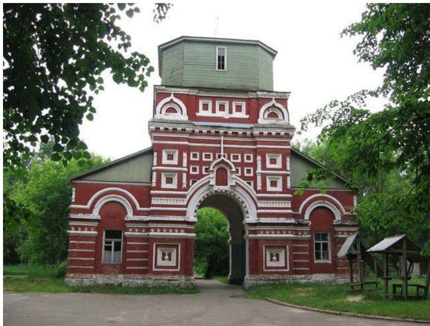
Святые ворота с надвратной церковью

Щербинина. Название образовано от имени Ивлий (Иоиль), а затем изменилось в «Евлево».