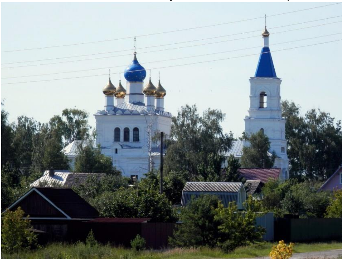
Церковь Спаса Преображения, 1896-1904 гг., с. Андреевские Выселки

С 2000 года ведется восстановление храма, возобновились богослужения.