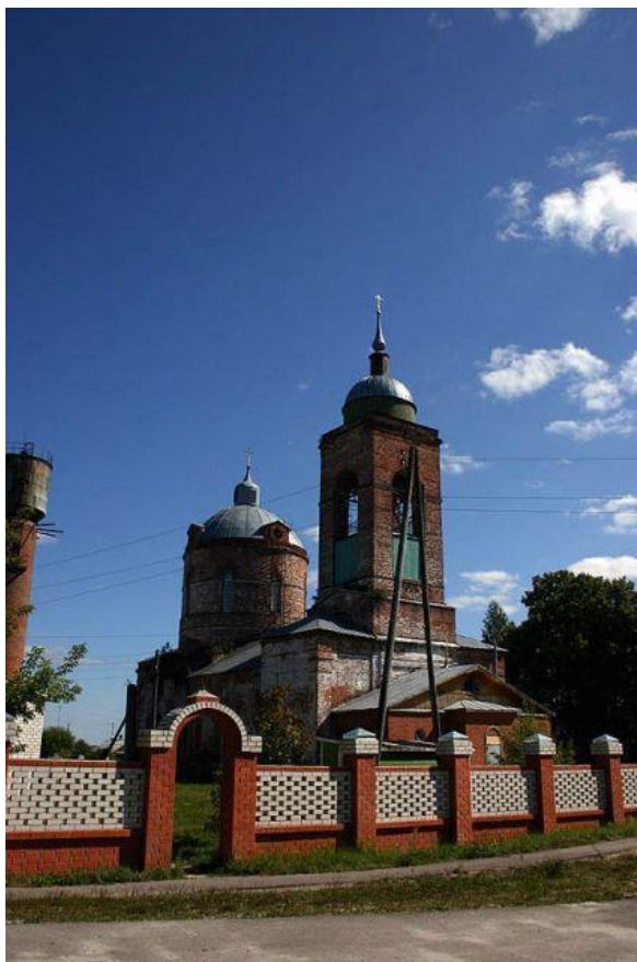
Церковь Покрова Пресвятой Богородицы в селе Пустоша, 1831, 1845 гг.